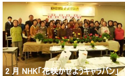
2月NHK「花咲かせようキャッパン」