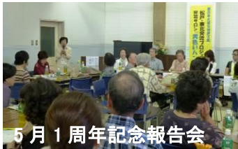
5月1周年記念報告会