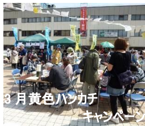
3月黄色ハンカチキャンペーン