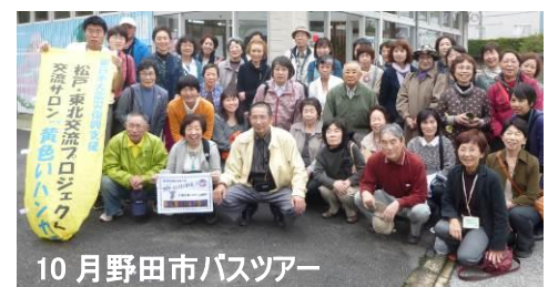
10月野田市バスツアー