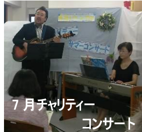
7月チャリティーコンサート